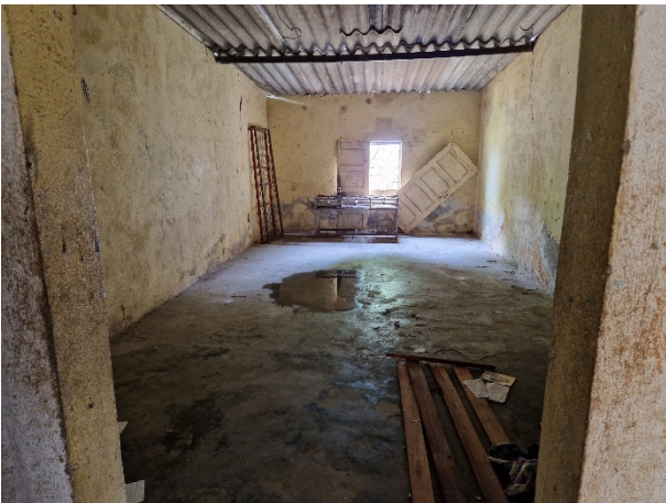
Wasser am Boden, undichtes Dach.