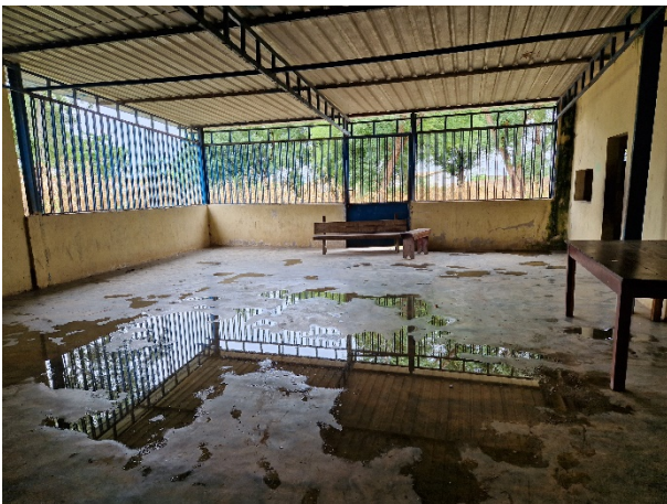
Dieser neuere Teil wurde 2008 als «Ess- und Studiersaal» angebaut, mit wenig Erfolg in der Regenzeit.