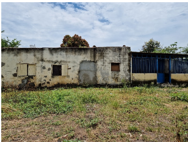
Aussenansicht mit ehemaligem Neu-Anbau.