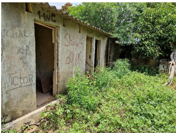
Ehemalige WC- und Duschanlagen, ausserhalb des Internats.