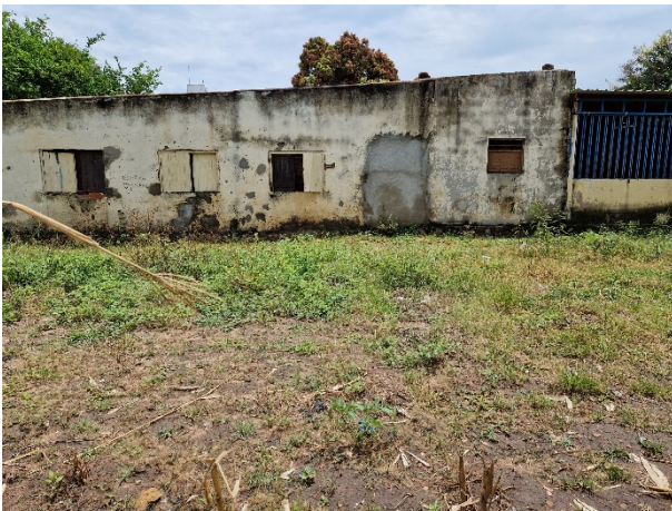
Aussenansicht eines Teils des Internats

In der Rubrik «Auszuführende Arbeiten» wird detailliert erklärt, welche wichtigen Arbeiten vorgenommen werden müssen.