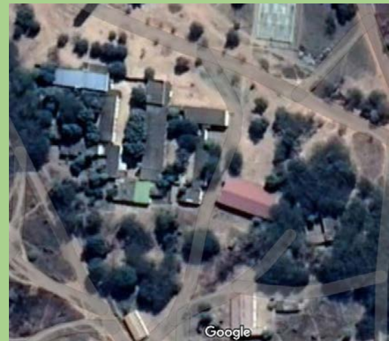
Missionsstation Cubal um 2021

Willi Rüegg Missionários de La Salette CESAFE Mapunda CP 330 Lubango / ANGOLA E-mail: info@africansun.ch Schweiz: 0041 79 649 9943 Angola: 00244 946 38 33 07