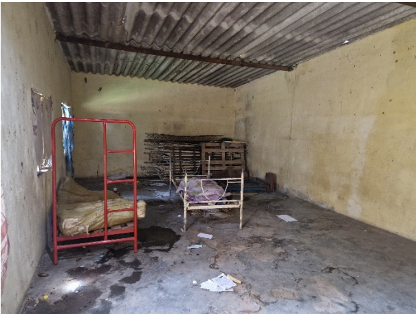
Ein weiterer Schlafsaal, der aufzeigt, dass das Dach viel zu tief angesetzt ist – Hitzestau.